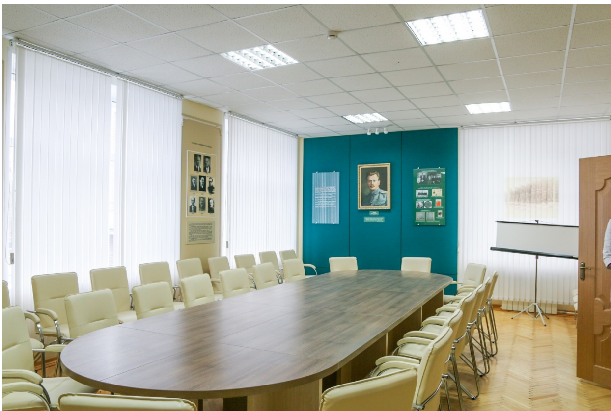
Музей академика Н.П. Кравкова