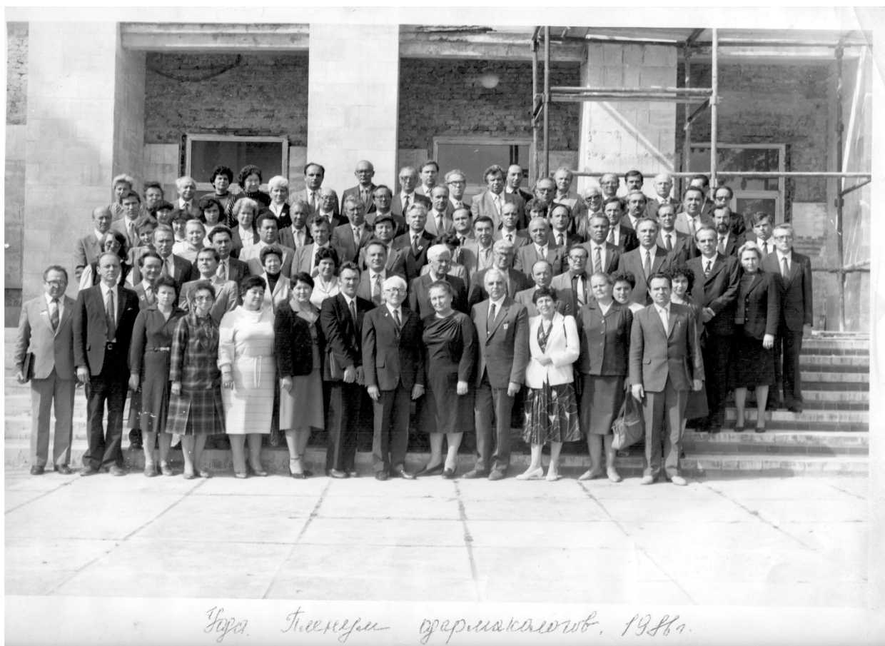
Уфа. Пленум фармакологов. 1986 г.

В.А. – декан фармацевтического факультета, заведующий кафедрой фармакологии, фармакогнозии и ботаники МГОГИ).