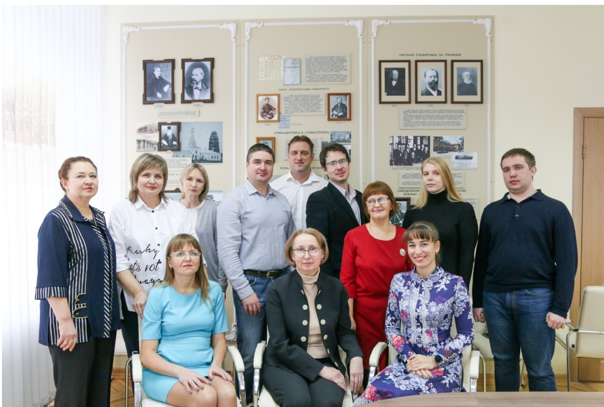
Сотрудники кафедры фармакологии в музее академика Н.П. Кравкова